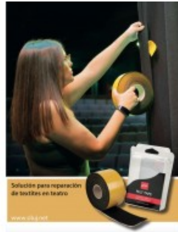
Solución para reparación de textiles en teatro www.siluj.net