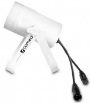
Including two adjusted lenses for variable beam angles