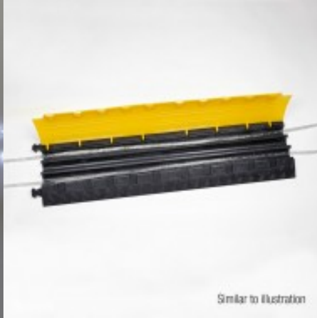
Similar to illustration