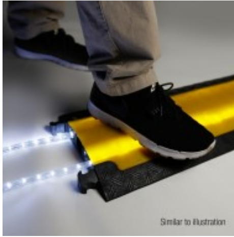
Similar to illustration