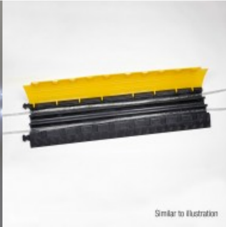
Similar to illustration