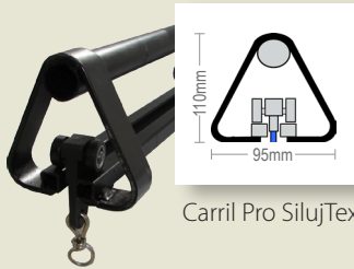
Carril Pro SilujTex