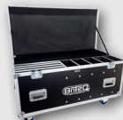
B03297 Flightcase para 4 BT-AKKUPOLE