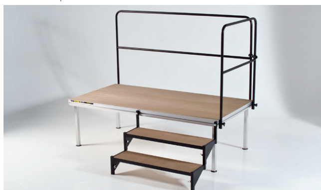
Barandillas y escaleras