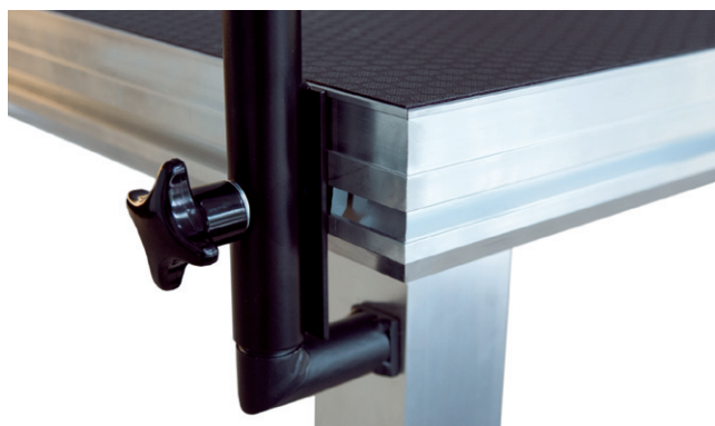
Fijación de las barandillas en la ranura con tuercas correderas