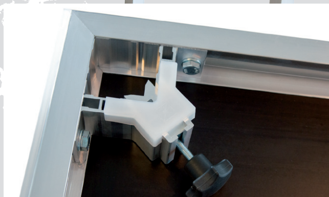
En la esquina variable se montan las patas en segundos