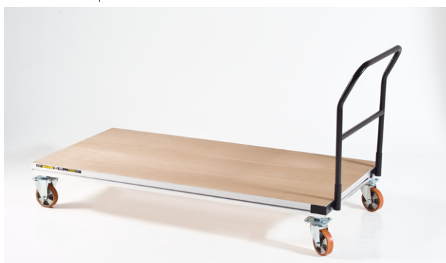
Carros de transporte