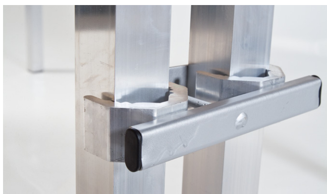
Conectores de patas