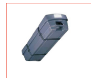
Vista Flightcase ABS con ruedas