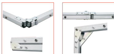
Vista pestillos Lock & Load

El pestillo Lock & Load, está diseñado para facilitar la operación de montaje y desmontaje. Los pestillos Lock & Load se sujetan fuertemente a la tela, haciendo que el marco sea extremadamente rígido. Partes del pestillo están internos para una mejor protección. Estas ventajas hacen que la pantalla sea muy precisa y resistente.