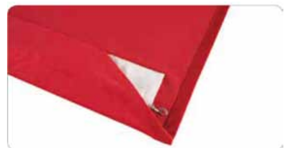
Terminación con bolsa y peso