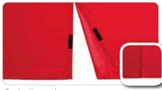
Terminación con velcro