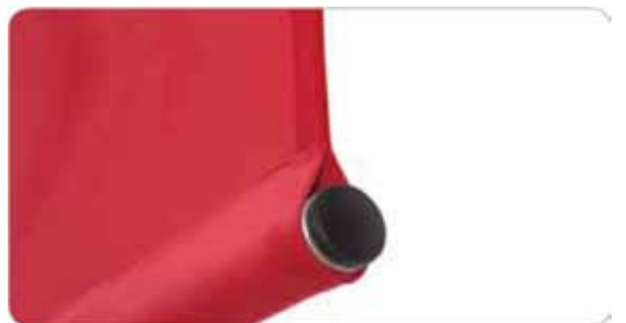
Terminación con bolsa para tubo