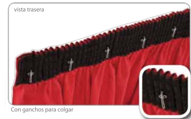
Con ganchos para colgar