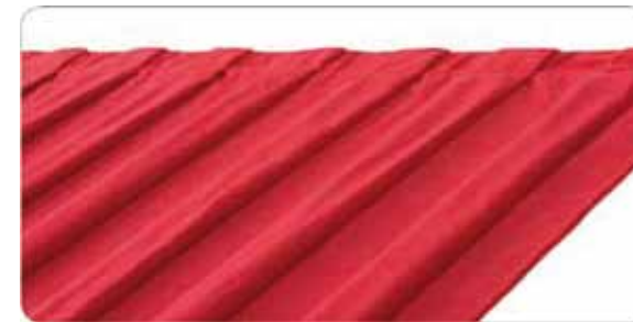
Confección fruncido al 100% Equivale a 2 veces la cantidad de tela en la fabricación del telón