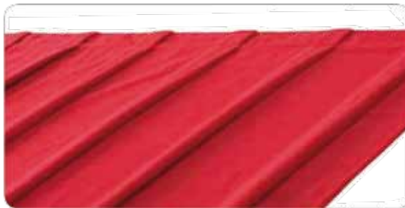
Confección fruncido al 50% Equivale a 1,5 veces la cantidad de tela en la fabricación del telón