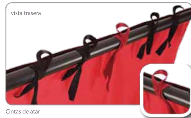
Cintas de atar