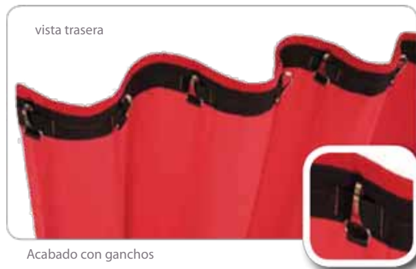
Acabado con ganchos

Estos sistemas de acabado son los que SilujTEX utiliza en los textiles que fabrica, existen otros diferentes si usted necesita un sistema distinto. En este caso deberá transmitirlo antes de preparar un presupuesto o la fabricación.