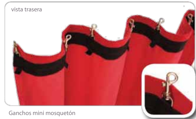
Ganchos mini mosquetón