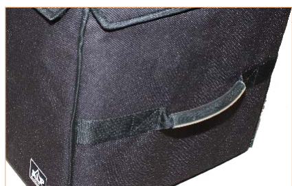
Asa reforzada y cierres perimetrales de velcro de rápida apertura