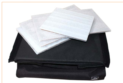
Fácil y rápido demontaje, permitiendo un almacenaje mínimo.

Almacenamiento: Las paredes internas se desmontan fácilmente, es por ello que se pueden recoger fácilmente, haciendo que estas sean totalmente plegables.