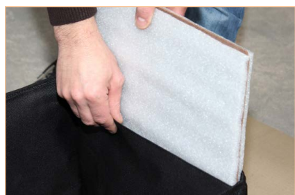
Paredes interiores removibles, fabricadas en espuma y madera