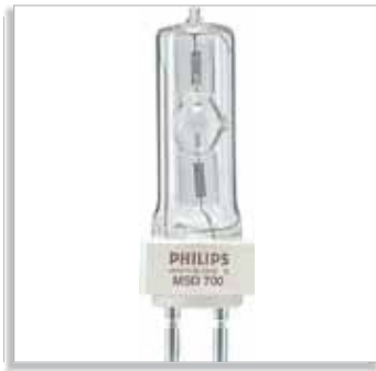
MSD 700, MSD 1200